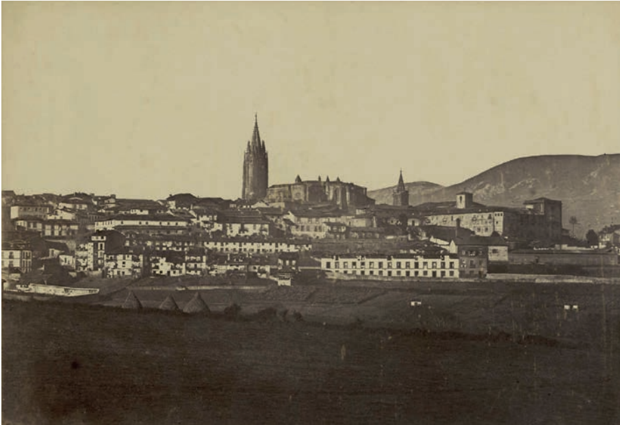
Rycina 1. Oviedo, widok miasta ( Vista general ), J. Laurent, 1870