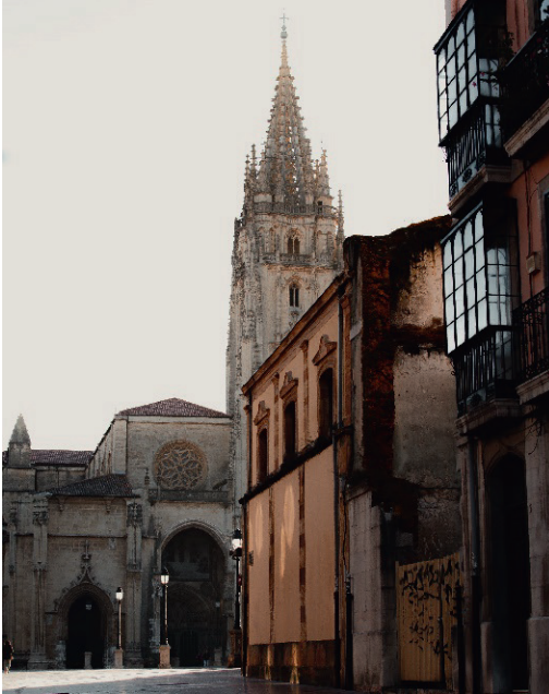
Rycina 2. Oviedo, widok na katedrę, L. Garó, 2021