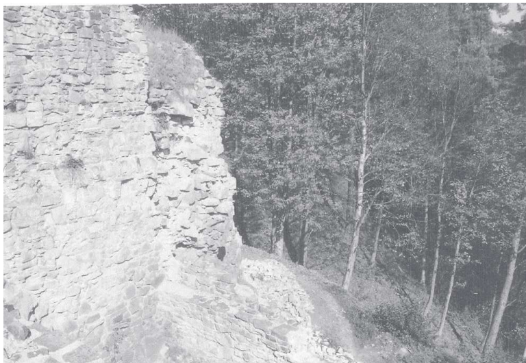
Ryc. 1. Wieża – widok wnętrza

wione w 1991 roku pod kierunkiem Adama Szybowicza. Badania koncentrowały się wewnątrz wieży i w jej bezpośrednim sąsiedztwie. Odgruzowano wówczas częściowo wnętrze baszty, szyję schodów prowadzących do jej najniższej kondygnacji oraz dziedziniec wschodni, zaś odsłonięte mury po zakończeniu prac częściowo zrekonstruowano (ryc. 1, 2) 26 . Po kilkuletniej przerwie podjęto je ponownie w roku 1996 i kontynuowano przez kolejne dwa sezony (do 1998; Chudzińska