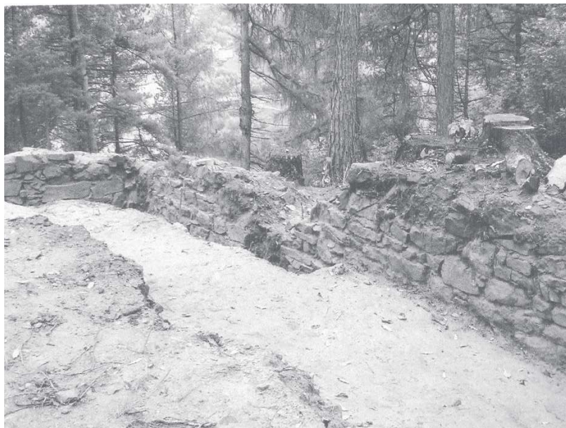
Ryc. 4. Fragment zachodniego budynku mieszkalnego (widok od północy)

W pobliżu narożnika północno-zachodniego odsłonięto pozostałości przypory o szerokości 2,5 m i długości około 4 m. Podobna może znajdować się symetrycznie w narożniku południowo-zachodnim.