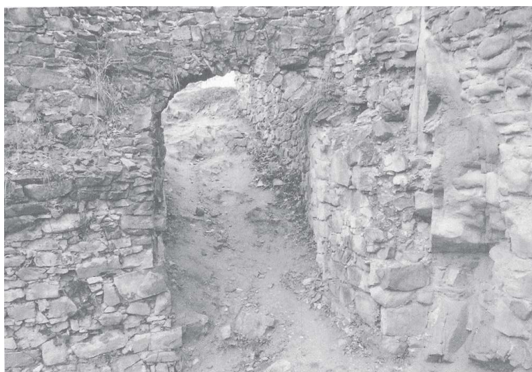
Ryc. 2. Wieża – szyja schodów (widok od wnętrza pomieszczenia)